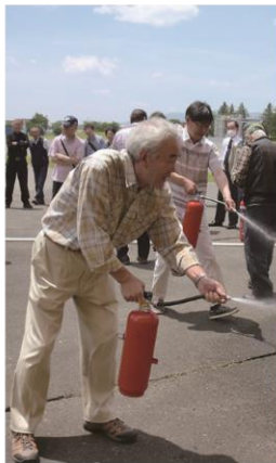
初期消火が大事ですよ～

6月24日、午前中バスにて、38名参加による岩手県立総合防災センター(矢巾町)にて、地震、火災等の講義と避難訓練を行い、実体験は有意義な経験となり、各地区参加者は、この経験を生かして自主防災に広げ、今後に役立ててほしいと思います。