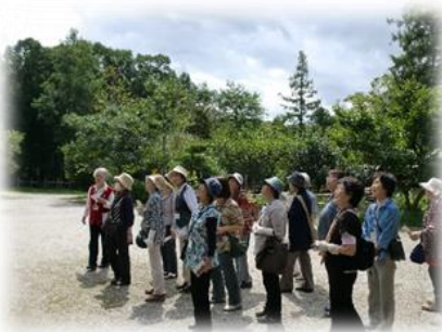
《ふれあい学級：奥州市》