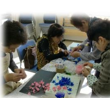
《アメリカンフラワー教室》