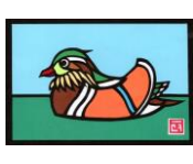
オシドリ 初心者向